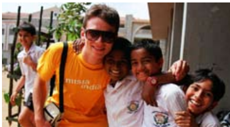
Z histórie projektu