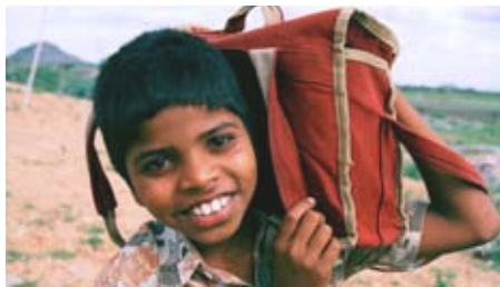
Radosť zo služby